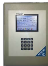
NEW MODEL Touch Screen Panel